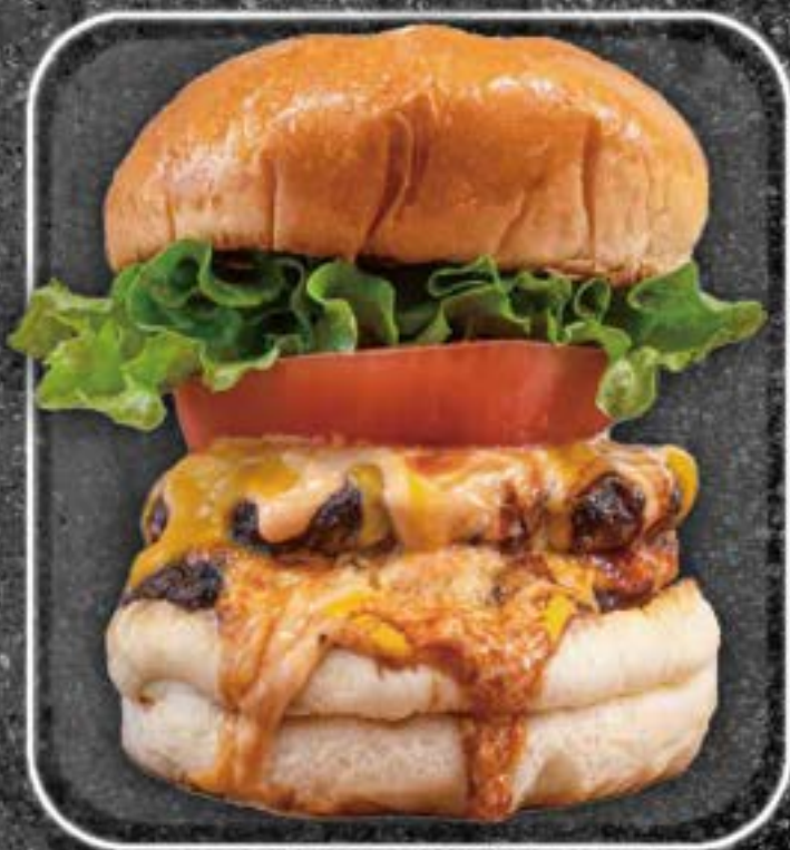
Double 1300yen Cheeseburger