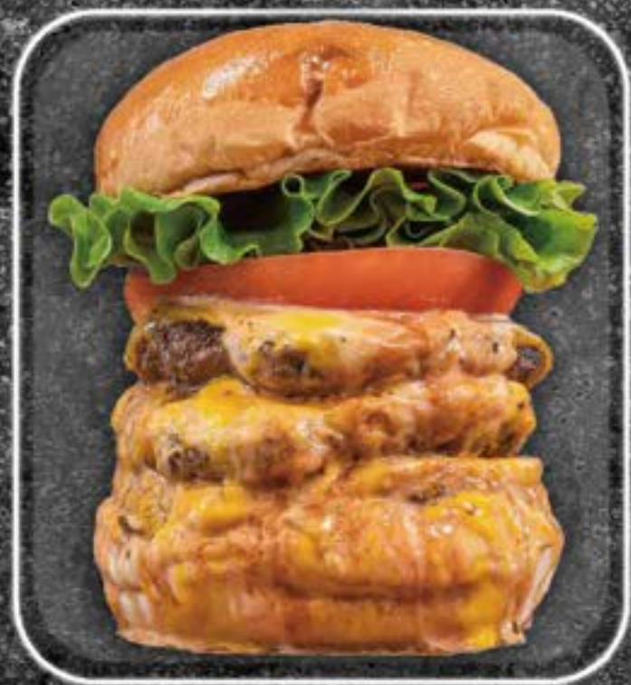
Triple 1800yen cheeseburger

パティー2枚 / チーズ2枚 / トマト / レタス / ピクルス / BBQ ソース / オーロラソース / マスタード