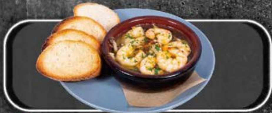
S hrimp Ajillo

アヒージョは1人前で最大2名でお召し上がり頂けます バゲット 4枚~となっております人数分での枚数注文を おすすめ致します