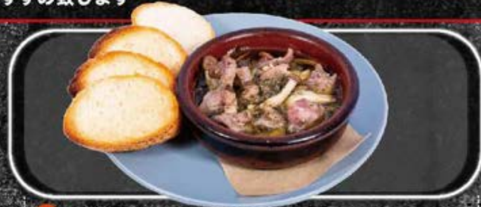
G izzard Ajillo