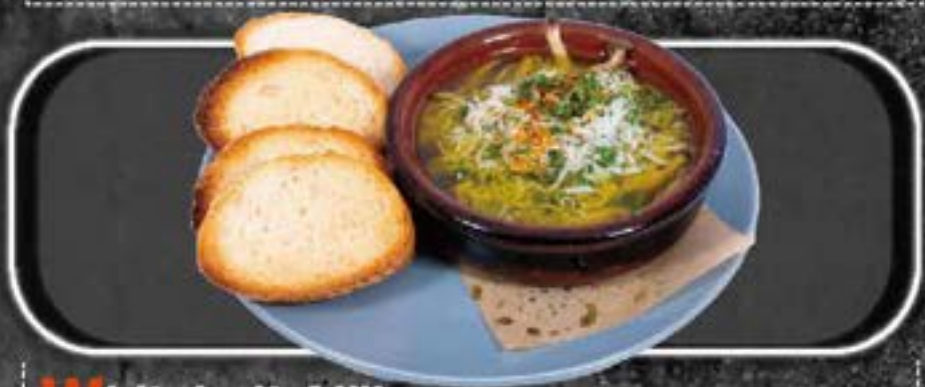
W hitebait Ajillo