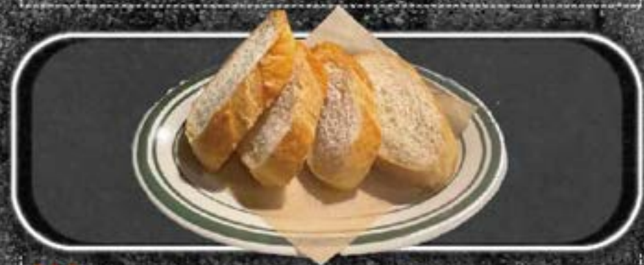
W hitebait Ajillo